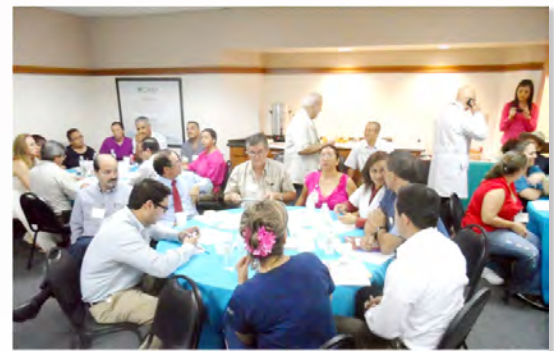
Compromiso, entrega y participación fueron las constantes entre todos los participantes.

En esta ocasión, los participantes tuvieron oportunidad de beneficiarse con la aportación de los fundamentos que permitan la creación de herramientas necesarias para la generación de las líneas de acción y los instrumentos para su aplicación que permitan fortalecer el sistema de Seguridad del Paciente dentro de la propia institución.