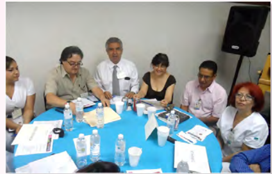
Mesas de trabajo interdisciplinarias.

Cada participante tuvo oportunidad de analizar el punto de vista del compañero por lo que, como resultado complementario, se logró la extensión de la visión del profesional de la salud inscrito.