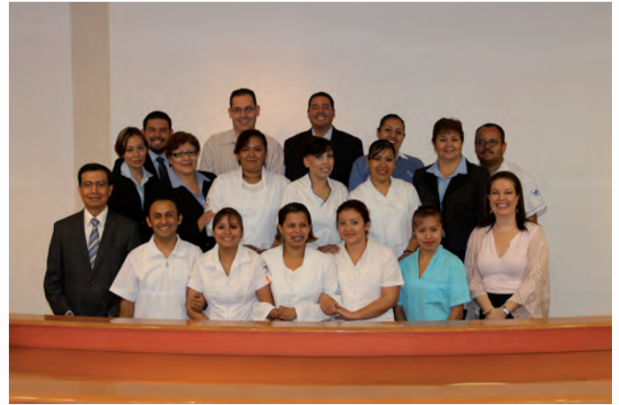
Participantes del curso

El contar con una serie de profesores invitados de diferentes instituciones, los cuales compartieron su vasto saber y su amplia experiencia en los diferentes tópicos, enriqueció el contenido y reforzó la importancia de la labor de la central de equipos y esterilización en la prevención de infecciones intrahospitalarias como principal objetivo, en la centralización de los procesos y en la búsqueda continua de la calidad.